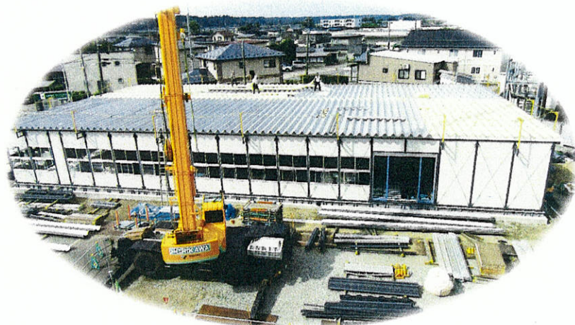
基礎施行中 8月18日現在の進捗状況

河辺市民サービスセンターの大規模改修工事に伴い、センターの全業務は現在センター敷地内に建設中の仮設庁舎へ移転されることとなります。